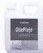
Til pleje og vedligeholdelse af olierede trægulve