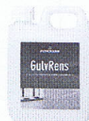
Til afrensning inden trægulvet lakeres