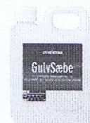
Til vask og rengøring af lakerede og olierede trægulve